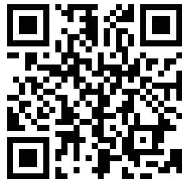
新規登録 QR コード